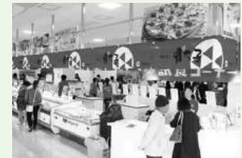
めんたいパーク伊豆

サービスセンター前【7:30出発】== == <中央道・圏央道・東名道> == == 富士山ガーデンファーム (スーパーホワイトコーン3本収穫)【10:00~10:30】== == 伊豆フルーツパーク (メロン狩り1玉お土産付き メロン1/4試食)【11:00~12:00】== ==伊豆 代官屋敷 (代官御膳の昼食)【12:15~13:15】== == めんたいパーク伊豆/道の駅 伊豆ゲートウェイ函南 (工場見学・お買物)【13:30~14:30】== == <東名道・圏央道・中央道> == == サービスセンター前【17:00着予定】 取扱旅行者 (株)緑トラベル