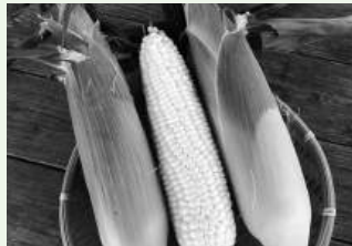
スーパーホワイトコーン