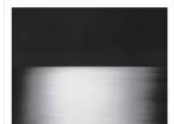
杉本博司 絶滅写真 SHIGEMITSU HIROSHI'S EXTINCT PHOTOGRAPHY 2026年6月16日(火)～9月13日(日) 東京国立近代美術館